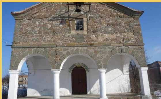
Църквата в с. Орлинци, Община Средец

Източник: Православните храмове в Община Средец, http://vardarsko.org/